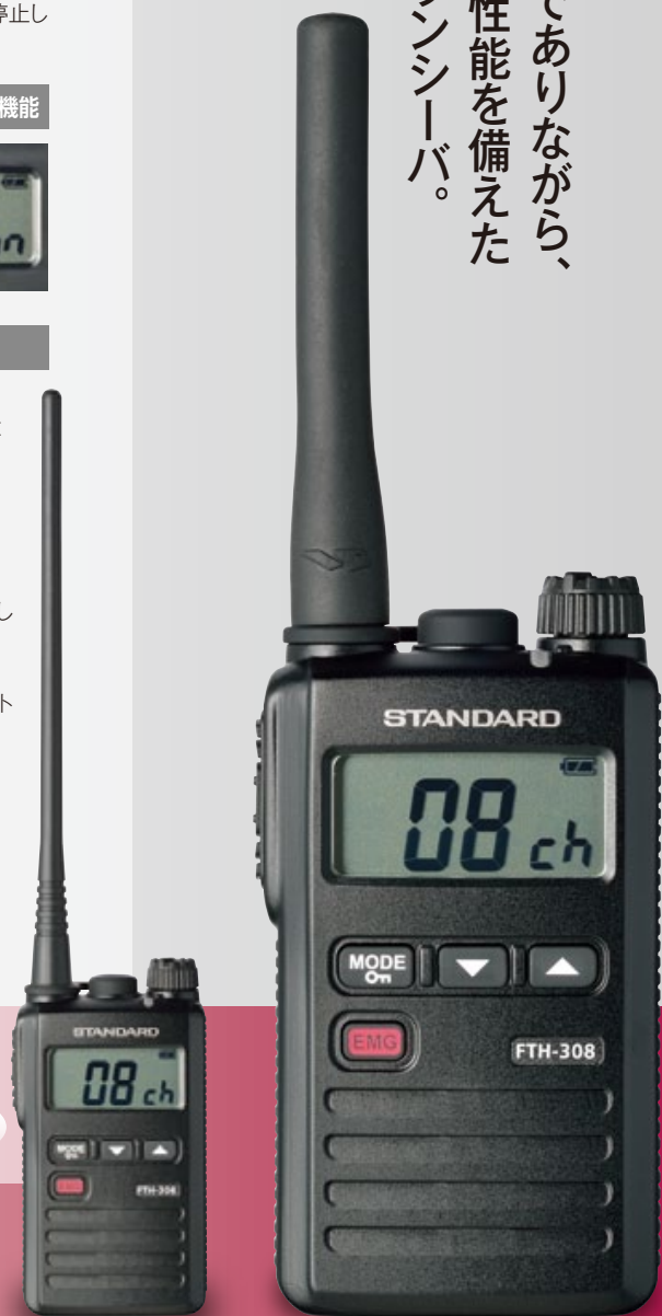
FTH-308L(高利得アンテナモデル)